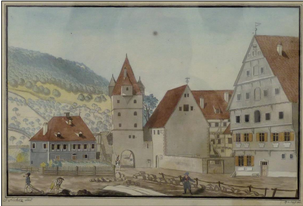
Spital mit Spitaltor und Heilig-Geist-Spalkirche St. Leonhard von Jakob Frühholz, 1810, Museum im Alten Bau

Anfangs des 19. Jahrhundert beginnt die Abrissphase. 1809 wird der Chor der Heilig-Geist-Spalkirche abgebrochen und 1843 folgte das baufällige Schiff, das vordem als Scheuer diente; 1898 wurde das auf der Stadtmauer sitzende Hauptgebäude des Spitals samt Scheuer auf Abbruch verkauft. An dieser Stelle wurde das erste Postamt erbaut. 1967 erfolgte der Abbruch des Seelhauses (Ledergasse 3); die im Anschluss an das Postgebäude noch stehenden restlichen ehemaligen Spitalgebäude verschwanden zu Beginn der 1980er Jahre.