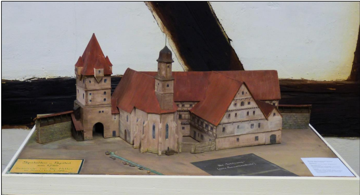
Modell des Spitals mit Spitaltor und Heilig-Geist-Kirche um 1780, Museum im Alten Bau

1406 wird das erste Pfründnerhaus durch den Erwerb eines größeren Hauses zum Viehhaus umgewandelt, das später als Salzstadel fungierte (Ledergasse 2). Die 1394 erstmals genannte St. Leonhards-Kapelle wurde 1471/72 zur Heilig-Geist-Spalkirche erweitert und 1615 erneuert. 1486 erwirbt man das ‚Neue Haus‘, in dem sich seit dem frühen 16. Jahrhundert der Sitz der Spitalverwaltung befand (Karlstraße 24). Schließlich errichtet man 1520/21 im Anschluss an das Viehhaus eine zweite Scheuer und auf dem Platz zweier anderer Häuser an der Stadtmauer das Seelhaus. Seit dieser Zeit weist das Spital den Gebäudebestand auf, der den Spitalkomplex bilden sollte.